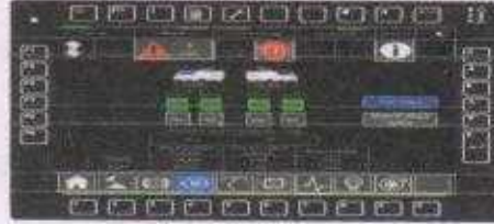
Figure 110 : TSD status screen