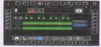
Figure 111 : Motor status screen