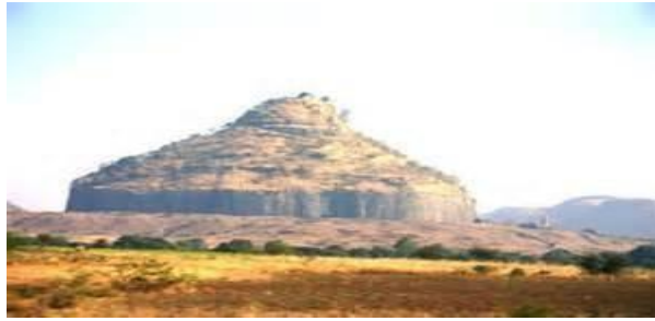
दौलत ब दबीबीक मकबर