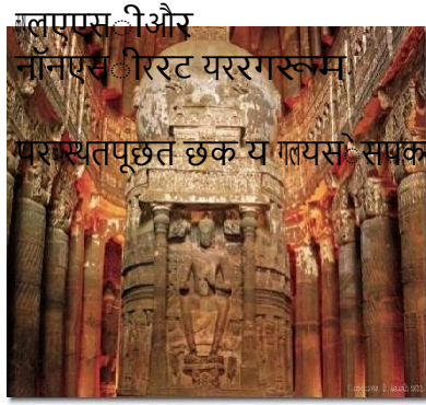
गलापसि और नागसिरीरट यररगस्वम् पराथतपूछत छक य गलयसि सप्रका करके बुकदकए सि सकेतेहैं)